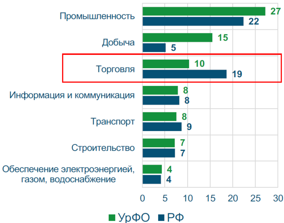
Доля выпускников СПО технических специальностей в отрасли, %