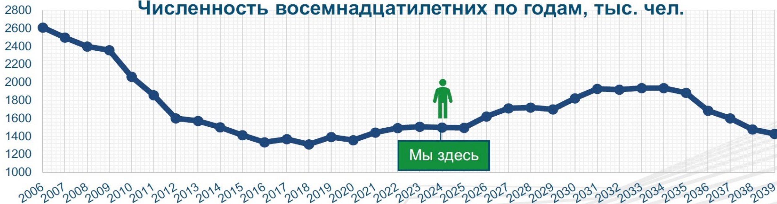
Численность восемнадцатилетних по годам, тыс. чел.