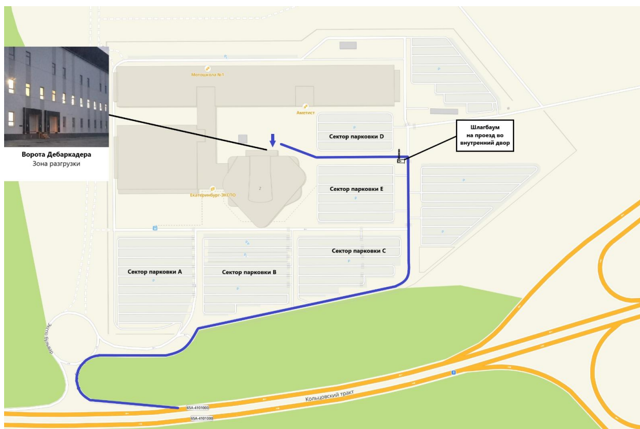
Схема проезда к дебаркадеру г. Екатеринбург ЭКСПО-бульвар, дом 2