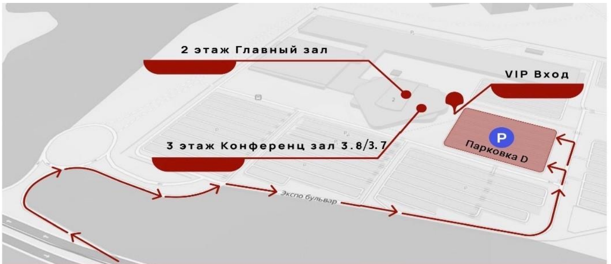
Схема расположения закрепленных помещений МТС Live Холл