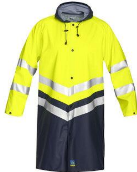
Плащ от воды повышенной видимости