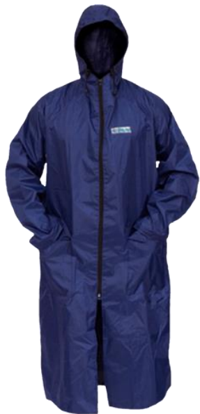
Плащ от воды